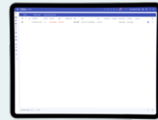
Lijstweergave van actuele alarmen